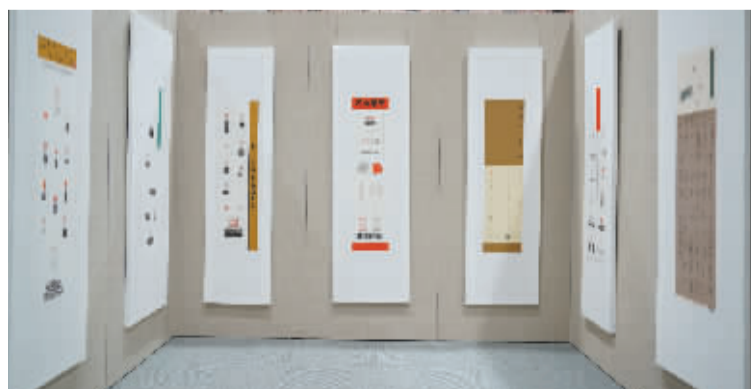
■入展的部分篆刻作品。