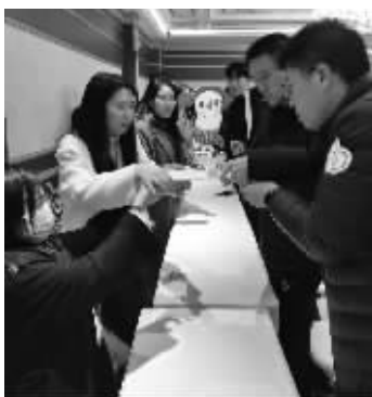
■小球为“媒”，传递情意。