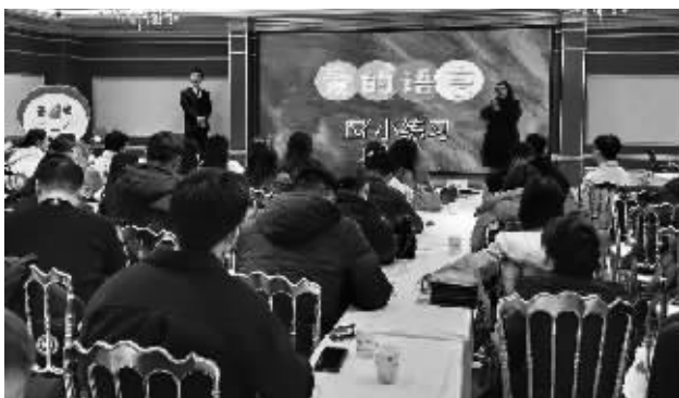
■一起学习“爱的八种语言”。