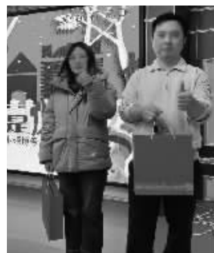
■和平医院女护士自我介绍。■获胜队代表。