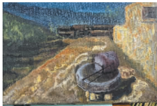
■塔崖风景梯田(油画) 党浩