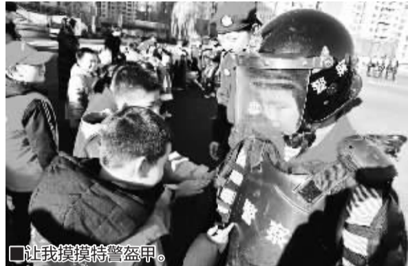
让我摸摸特警盔甲。

接下来是11名特警队员和45名小记者的拔河“友谊赛”,双方你来我往几个回合,最终,小记者们赢得了比赛的胜利。最让小记者们难忘的是坐上警用边三轮摩托车和冲锋车,这直接把大家的兴奋值“拉满”了。小记者们还参观了装备库,各种警用装备让他们大开眼界。活动最