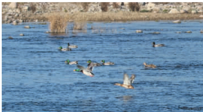
■或游或飞的绿头鸭。