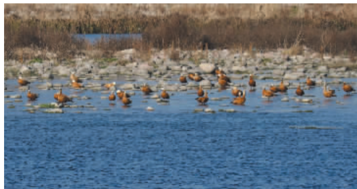
■赤麻鸭在水边休憩。