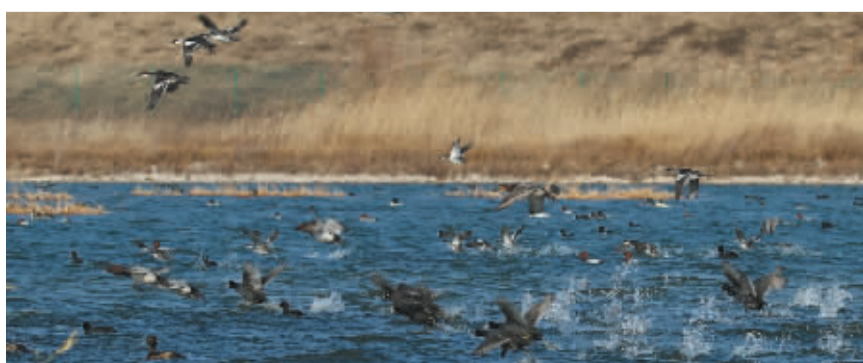
■各种水鸟在水面嬉戏。