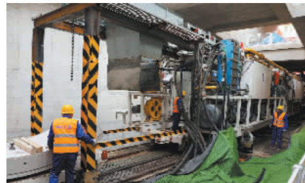
■石家庄地铁6号线首台盾构机始发。

近年来,石家庄市委、市政府高度重视文化旅游产业发展,在文旅业态创新上不断探索,高频次开展文旅主题推广活动激发市场消费潜能,围绕音乐、体育两个IP,西柏坡、正定古城、赵州桥三个品牌等,全面推进文旅融合向更深层次迈进、更广领域拓展、更高水平提升,石家庄文旅发展进入快车道。