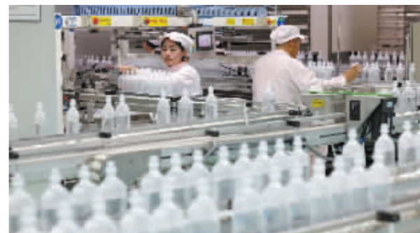
■石家庄四药工人在生产线上忙碌。