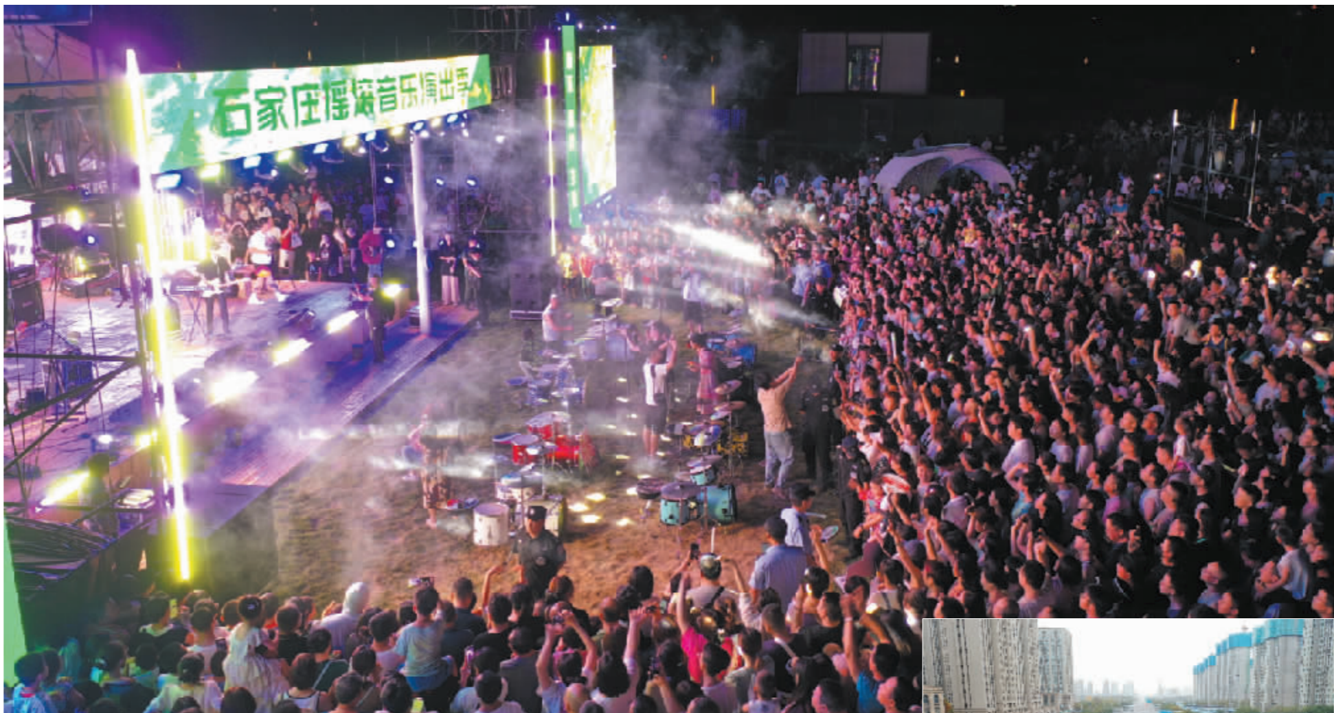
■石家庄摇滚音乐演出季现场人山人海。

11月20日,对于石家庄城建来说,是一个好日子,4条(段)路实现通车。仓盛路(建设大街-建华大街)、嘉华路(塔坛大街-胜利大街),以及裕翔街快速连通工程桥下辅路(仓盛路-方都路)、裕翔街(方都路-南三环)旧路翻新等道路工程建成通车。其中,仓盛路(建设大街-建华大街)全长3公里,建设标准为城市主干路,标准段采用双向六车道布置,两侧设置非机动车道及人行道;嘉华路(塔坛大街-胜利大街)全长1.1公里,建设标准为城市次干路,标准段采用双向六车道布置,两侧设置非机动车道及人行道;裕翔街快速连通工程桥下辅路(仓盛路-方都路)和裕翔街(方都路-南三环)旧路翻新工程全长3公里,两侧同步建设、翻新非机动车道。这4条(段)路的通车,对于完善城市路网,特别是优化石家庄市南部区域交通路网,进一步畅通城市“微循环”,完善城市功能,提升城市品质,方便市民出行具有重要意义。