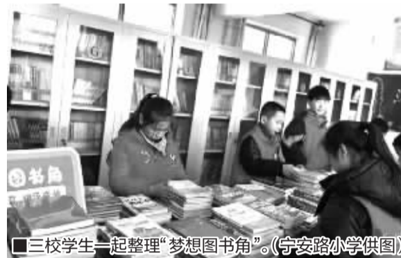
■三校学生一起整理“梦想图书角”。

活动当天, 三校学生还一起走进“梦想课堂”。课堂教师由志愿者团队组成, 目的是为了拓宽学生的视野, 接触更多有趣的知识。志愿者带来了书法课堂、趣味美术课堂、“梦想口袋书”朗读课。学习过后, 志愿者团队又组织