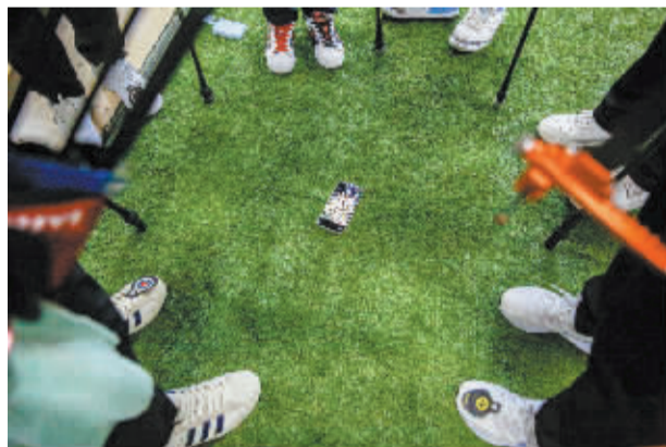
■上场前选手把手机放在地上拍合影。