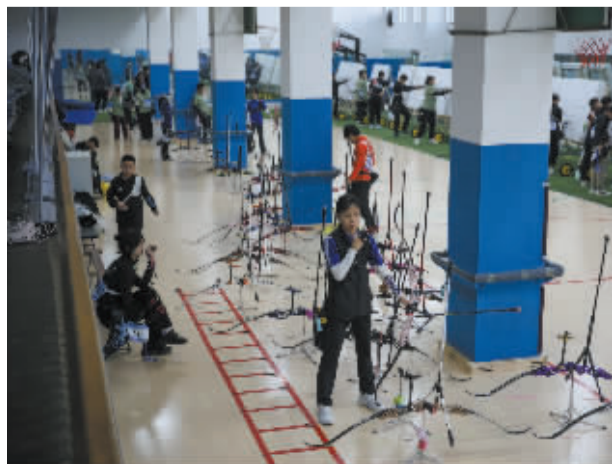
■上场前选手在进行适应性训练。