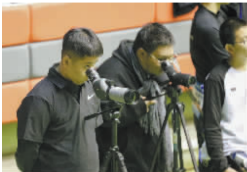
■教练员通过望远镜查看选手比赛情况。