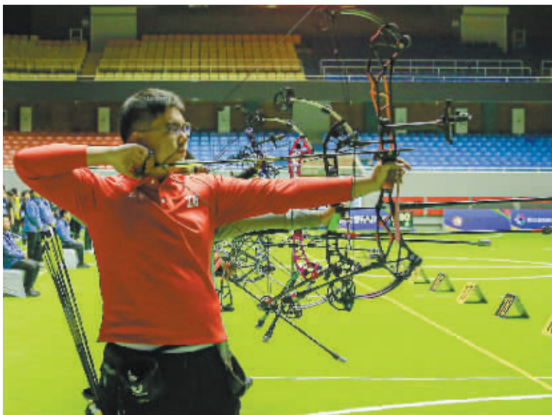
■石家庄选手在比赛中。