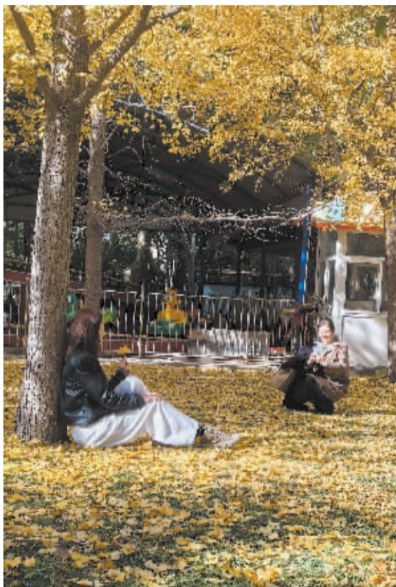
■裕西公园南广场的银杏林内,落叶铺满地,游客在里面拍照。