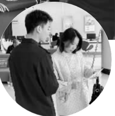
■晋州市公安局民警正为银行等办理业务的居民讲解防范非法集资有关知识。

集资宣传活动。活动中,赞皇县公安局经侦大队联合各部门在曲江村委会精心布置了宣传摊位。他们向来往居民发放宣传册,并现场答疑咨询,利用宣传展板生动形象地展示了非法集资、高息理财等金融陷阱的典型案列、表现形式及严重危害。在现场,民警耐心细致地向居民讲解金融安全知识,提醒他们警惕高收益诱惑,切勿盲目投资,守护好自己的财产安全。此外,民警运用实际案例深入浅出地讲解了关于非法集资的打击成效,让广大居民深刻认识到金融犯罪的危害性和法律责任,进一步增强了居民的法治观念和风险防范意识。