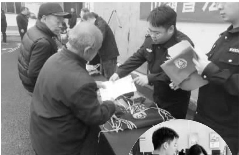
■赞皇县公安局民警正为居民发放防范非法集资宣传资料。

10月31日,在赞皇县委政法委组织下,赞皇县公安局经侦大队联合该县法院、县妇联等部门深入赞皇镇曲江村开展防范非法