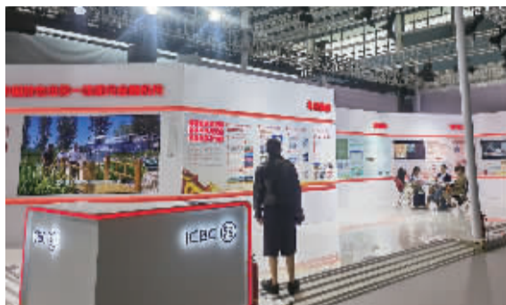
■工商银行远程银行中心(石家庄)。

工商银行的展示亮点还在于其深耕区域、服务大局的责任感和使命感。特别是在“扎根燕赵”方面,工行充分展示了在全面服务京津冀协同发展、服务雄安新区建设方面所做出的积极贡献,彰显了其作为国有大行的担当与作为。