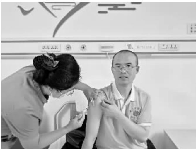
■李先生正在注射动员剂。