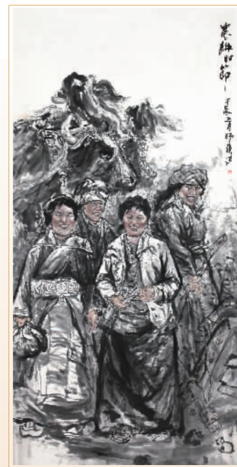
■农耕时节 刘师爽 / 作