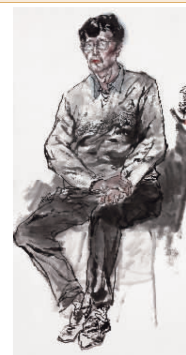
■老教师 刘师爽 / 作