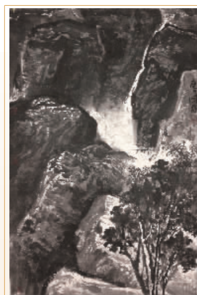
■柔水穿石 刘师爽 / 作