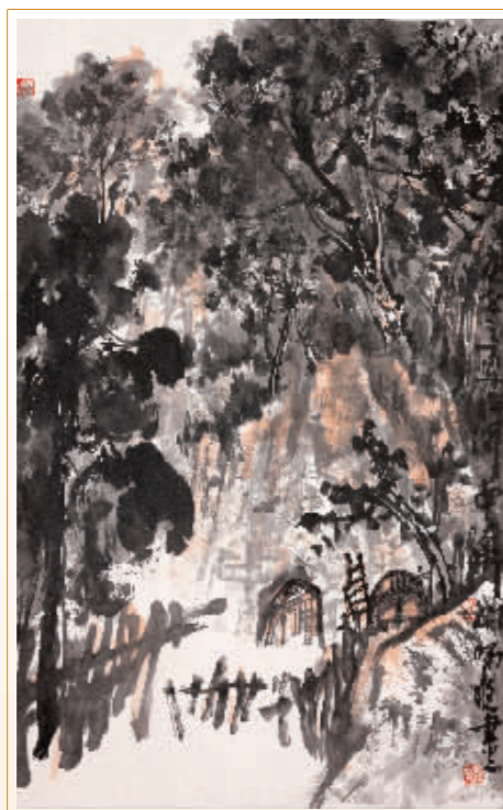
■晋东窑洞 刘师爽 / 作