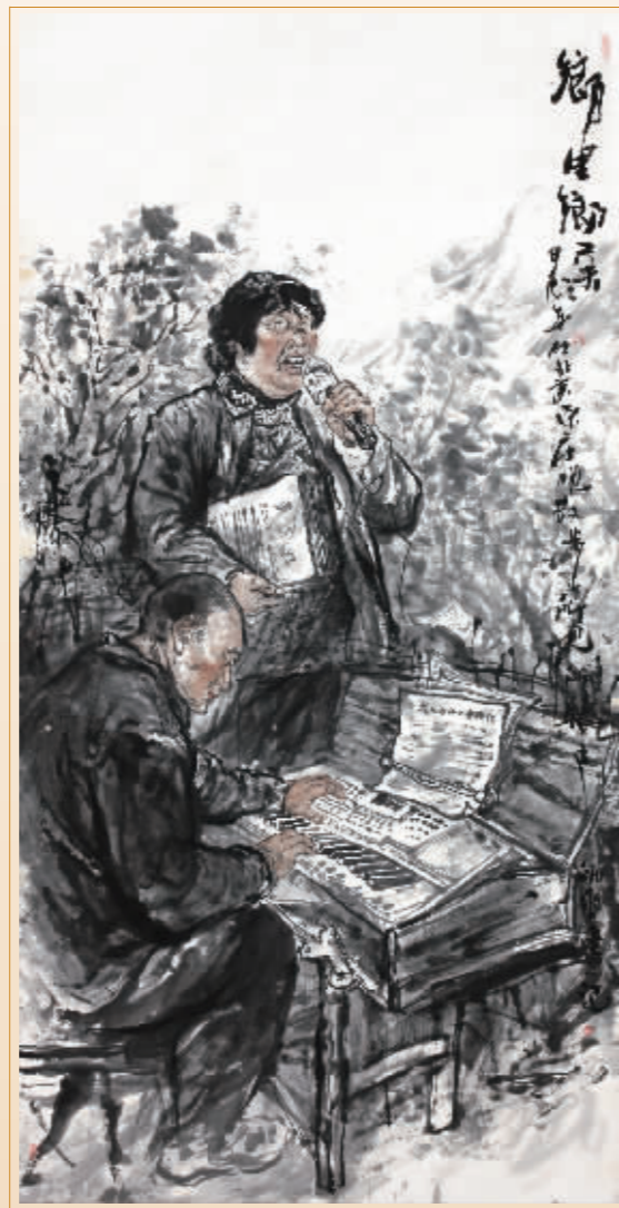
■乡里乡亲 刘师爽 / 作