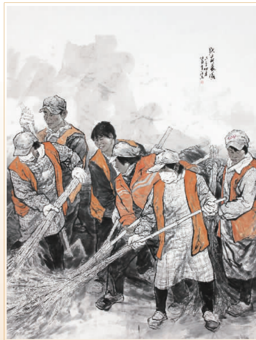
■宋庄晨曦 刘师爽 / 作