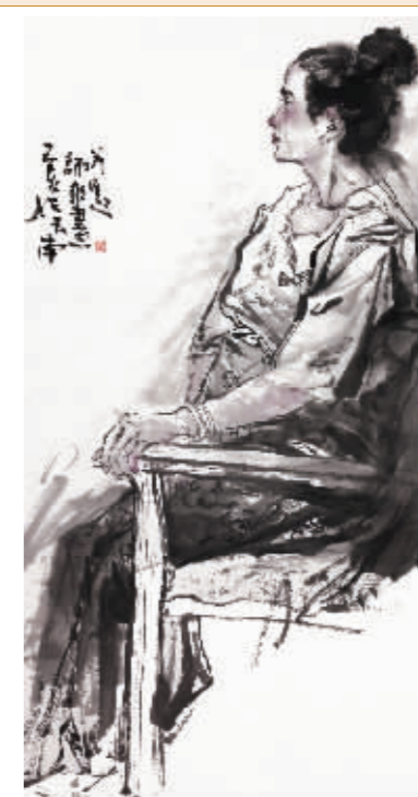
■坐木椅的女青年 刘师爽 / 作