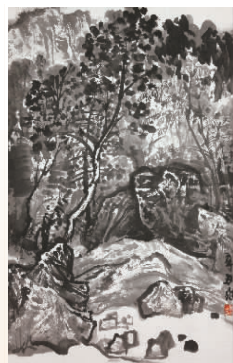
■晚声 刘师爽 / 作