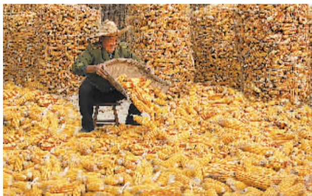
■丰收的喜悦。