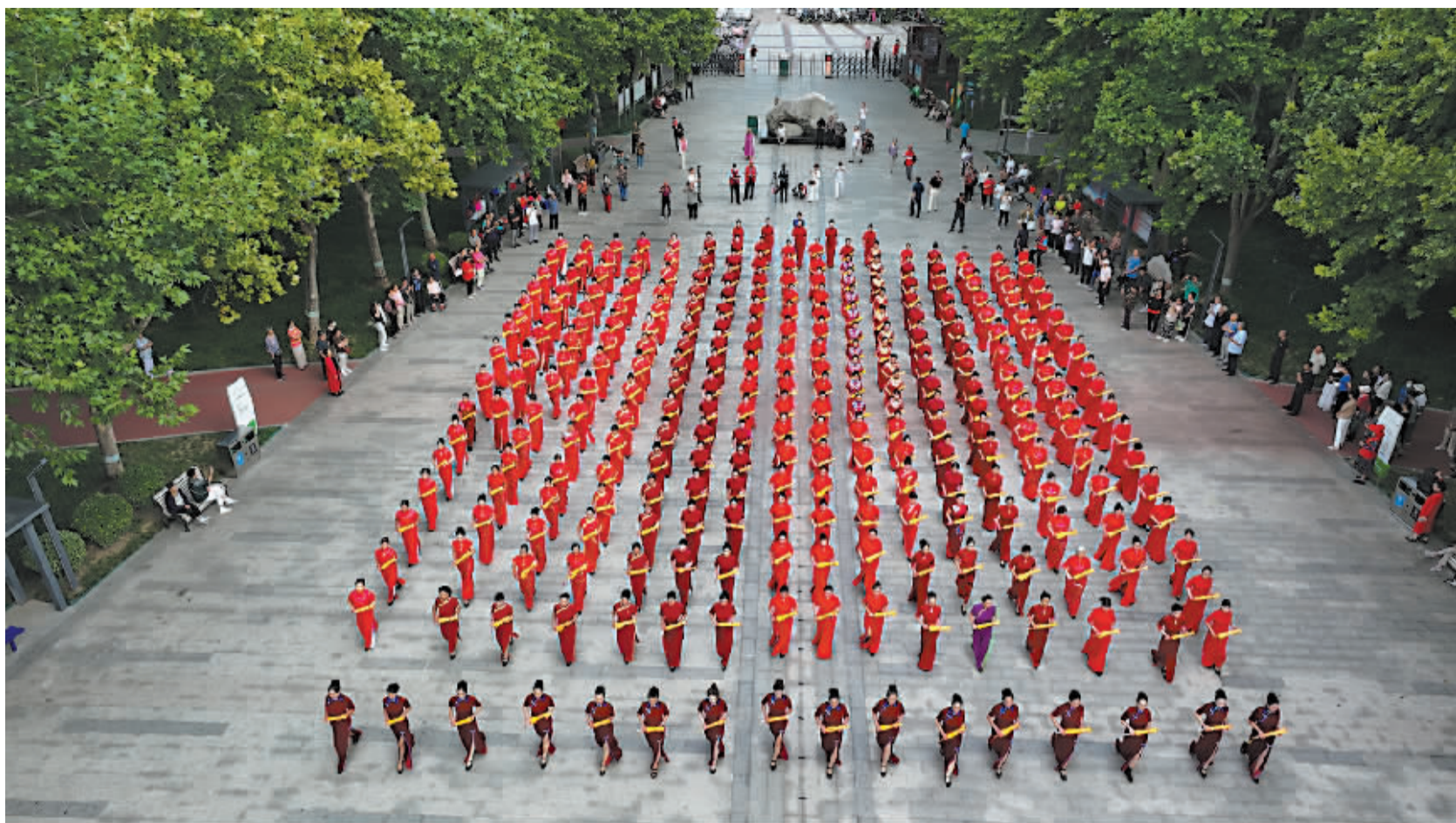
■旗袍佳丽展风姿。