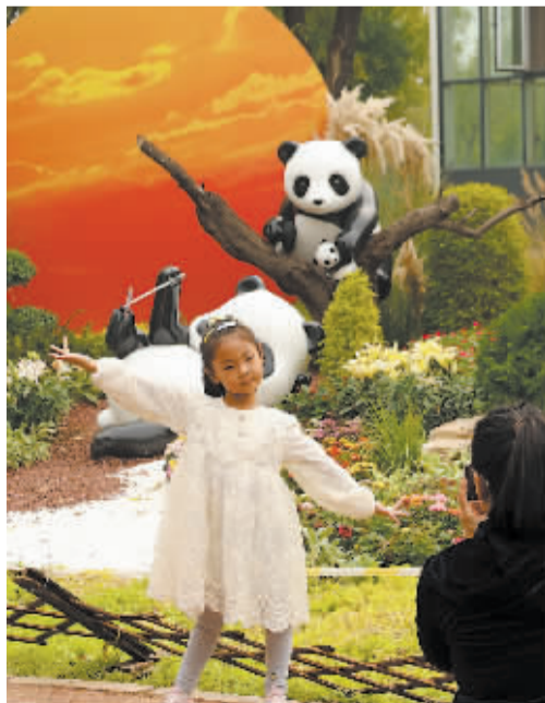
■留住美好瞬间。

滹沱河岸粉黛乱子草渐欲迷人眼,黄绿参半的颜色在整个城市蔓延,苍翠的西山仿佛一夜之间变得色彩斑斓。跨过寒露节气,秋的色彩越发浓郁。于是,当田间地头硕果累累一片丰收的景象,当越冬的候鸟掠过天空在湿地栖息……深秋的城市用最绚烂的色彩和无边风情,试图挽留住秋天的脚步。浓浓的深红,灿烂的金黄,是金秋时节的颜色,也是这个时节人们心中的色彩。让我们敞开心扉,拥抱澄澈蓝天,触摸这个最美时节吧!