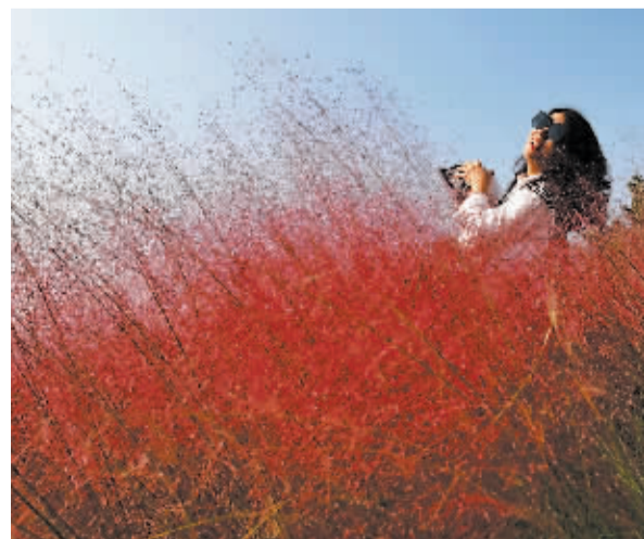
■粉黛乱子草美在金秋。