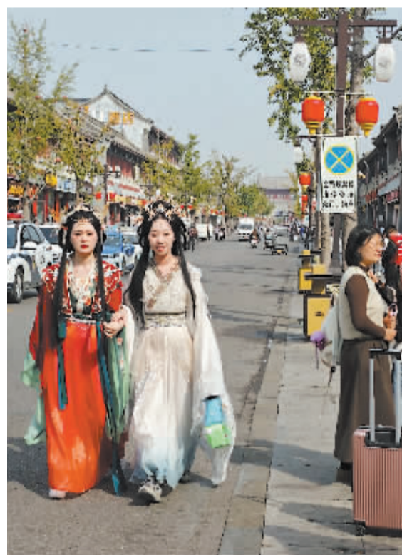
■古城汉服秀。