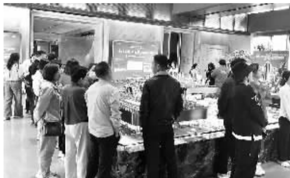
■“十一”假期新盘售楼处到访量和成交量都有显著增加。

10 月 3 日,记者在万科·翡翠书院营销中心看到,前来看房、选房、签约的购房者络绎不绝。据项目相关负责人介绍,假日期间,他们楼盘平均每 30 分钟就能成交一套。“今年国庆假期看房买房的人明显增多,人们购买信心也明显增强,购房者对市场都有了有一定的预判,不少持币待购的购房者,都是第一次看上喜欢的房型就立马签约,这种果断的情形在之前是比较少见的。”