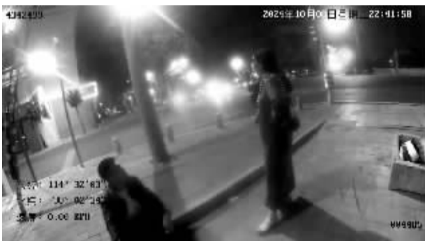
■欲轻生男子被救后与女友重归于好。(视频截图)

10月8日晚,石家庄市公安局交警局长安交警大队一名辅警成功救下一欲跳河轻生男子,避免了一场悲剧的发生。