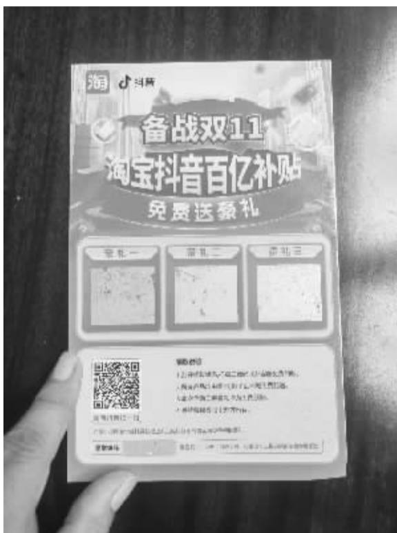
■来历不明的二维码千万不要扫。