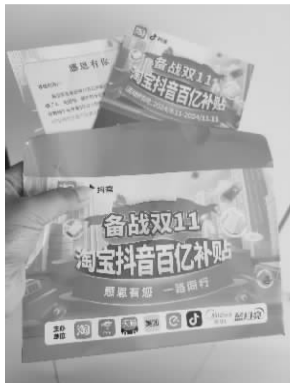
■快递到家的小广告别轻信。