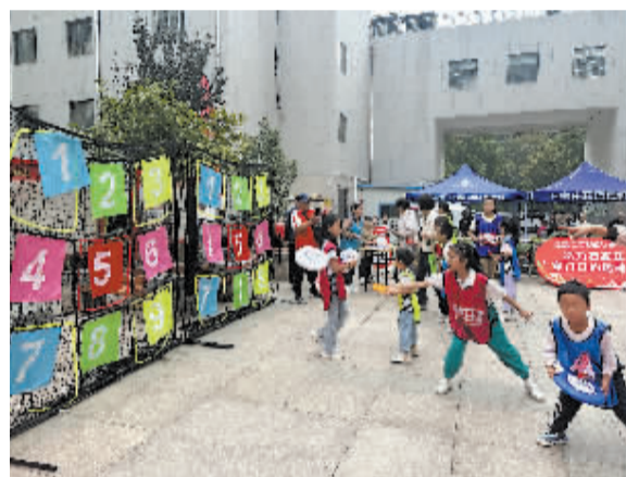
■运动会吸引居民踊跃参与。

本报讯(首席记者 杜慧)为进一步丰富辖区居民精神文化生活，增强全民健身意识，养成良好的体育锻炼习惯，日前，石家庄市新华区西三庄街道汇君城社区和长安区中山东路街道省四院社区相继举办了形式多样的社区运动会，吸引了辖区居民的踊跃参与。