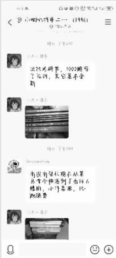
■大学校园里二手交易很活跃。