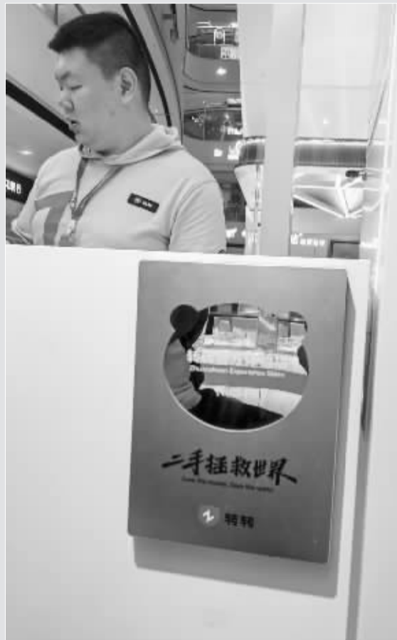
■万达广场里的二手手机交易线下店。