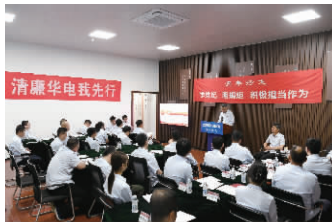
■青年学党史沙龙活动。