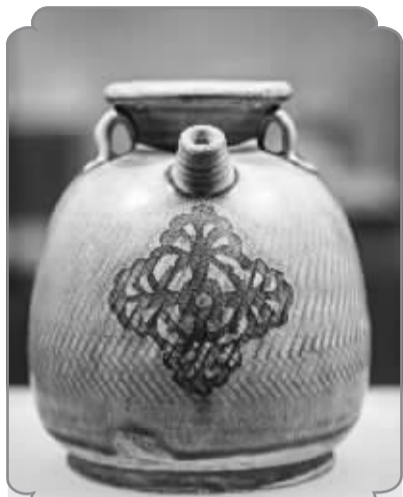
■黄釉刻席纹剪纸贴花双系执壶 (正定博物馆)。