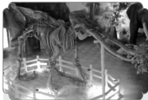
■古菱齿象化石 (迁安市博物馆)。