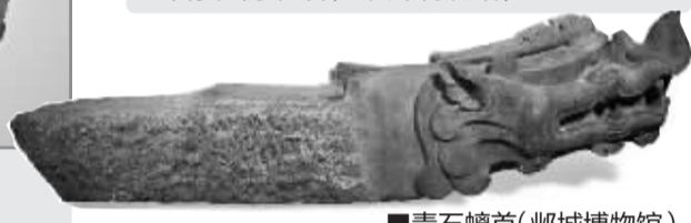
■青石螭首 (邳城博物馆)。