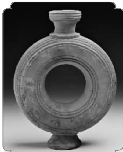
■唐代红陶圈带壶 (黄骅市博物馆)。