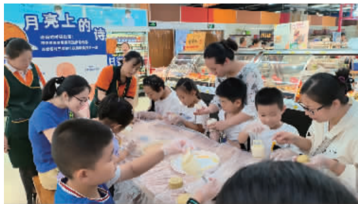
■在北国超市,小朋友们正在认真学习制作月饼。

又是一年中秋节,勒泰商业中心以“与你相月·一起中秋”为主题与消费者分享节日喜悦。在庄里街二层,“玉