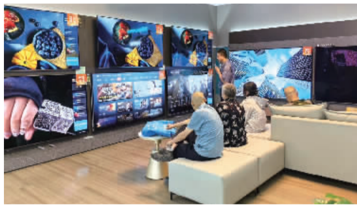
■在北国电器,消费者关注电视机的“以旧换新”活动。

兔”“明月”等中秋元素随处可见,将中秋佳节的传统习俗与现代装置结合,交织成一幅“最亮”的画面,这里就是“玉兔望月彩虹梯”。百余只玉兔灯错落而至,超级圆月点亮庄里街,消费者可以在此赏月许愿、打卡互动,感受节日的温馨氛围。