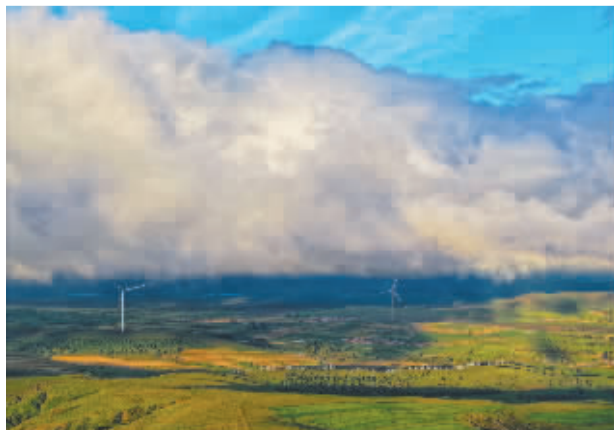
■风能、太阳能设备遍布草原林场,生态建设作为国家战略为千千万万百姓造福。