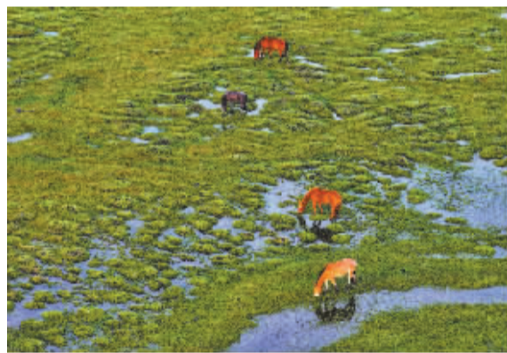
■马儿在草木葱茏、水源充沛的草原上悠闲地吃草。