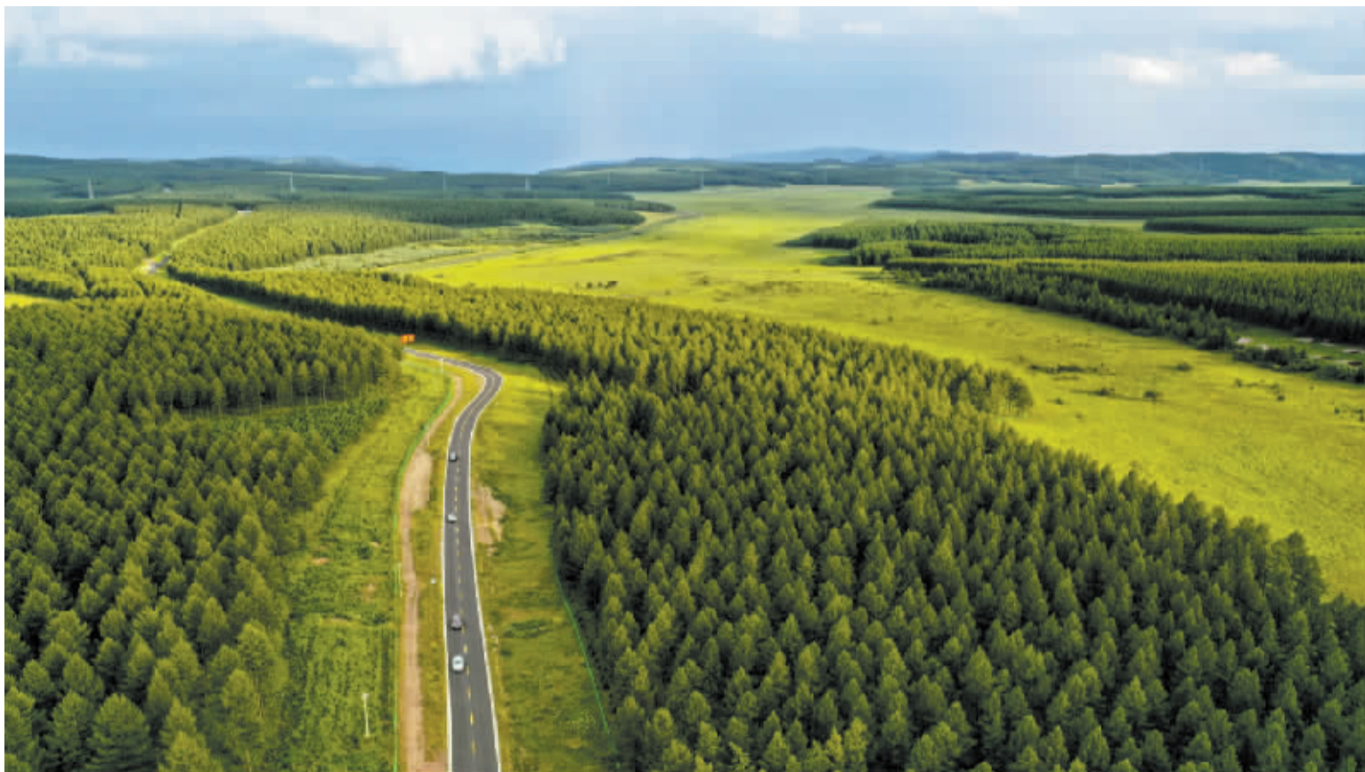
■三代塞罕坝人艰苦创业、接续奋斗,建成了世界上面积最大的人工林场。