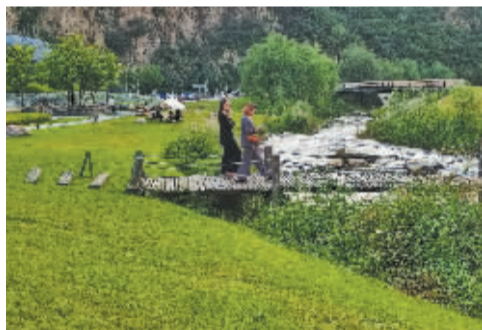
■承德市隆化县,绿水青山吸引着无数游客前来探访。