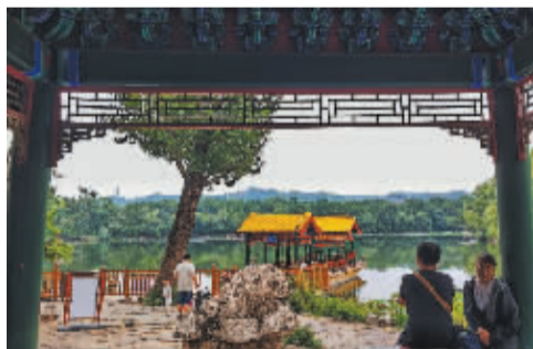
■游客在举世闻名的皇家园林——避暑山庄重檐画栋的烟雨楼小憩。