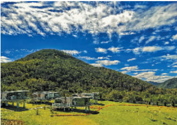
■处处将自然与现代化结合的文旅小镇,让游客流连忘返。