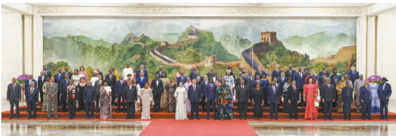
9月4日晚，国家主席习近平和夫人彭丽媛在北京人民大会堂举行宴会，欢迎来华出席中非合作论坛北京峰会的非方及国际贵宾。这是宴会前，习近平和彭丽媛同贵宾们集体合影留念。