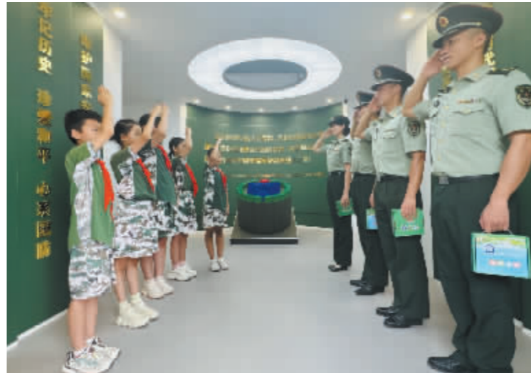
■华夏小学开学第一课讲国防安全。

新生入学仪式也少不了小礼物，新石小学送给一年级新生的礼物是高年级同学亲手制作的小风车，寓意乘风破浪。四维小学的礼物比较丰富，有“新学期拍照打卡”“动动小手，领取美好祝福”“抽盲盒，收获小学第一份礼物”等等。雷锋小学送给学生的是通过寄语墙寄给孩子们专属明信片，寄语是全体老师们亲手写下的祝福。上述一系列全方位且满满仪式感的迎新活动，让第一次步入小学校园的孩子感受到了细致温暖的呵护与陪伴。