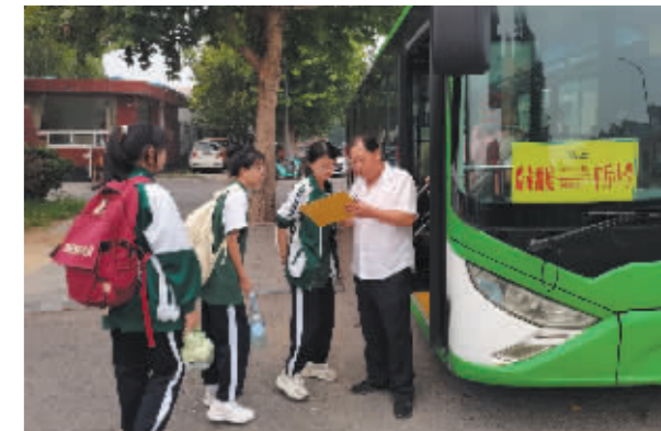
■中学生签到上车。

“我吃过饭了，慢点儿上车，注意脚下。”9月1日早晨，在石家庄市新城花园小区门口，学生们正在陆陆续续地登上38路车队设置的“瑞泰澜庭—鹿泉开发区学校”