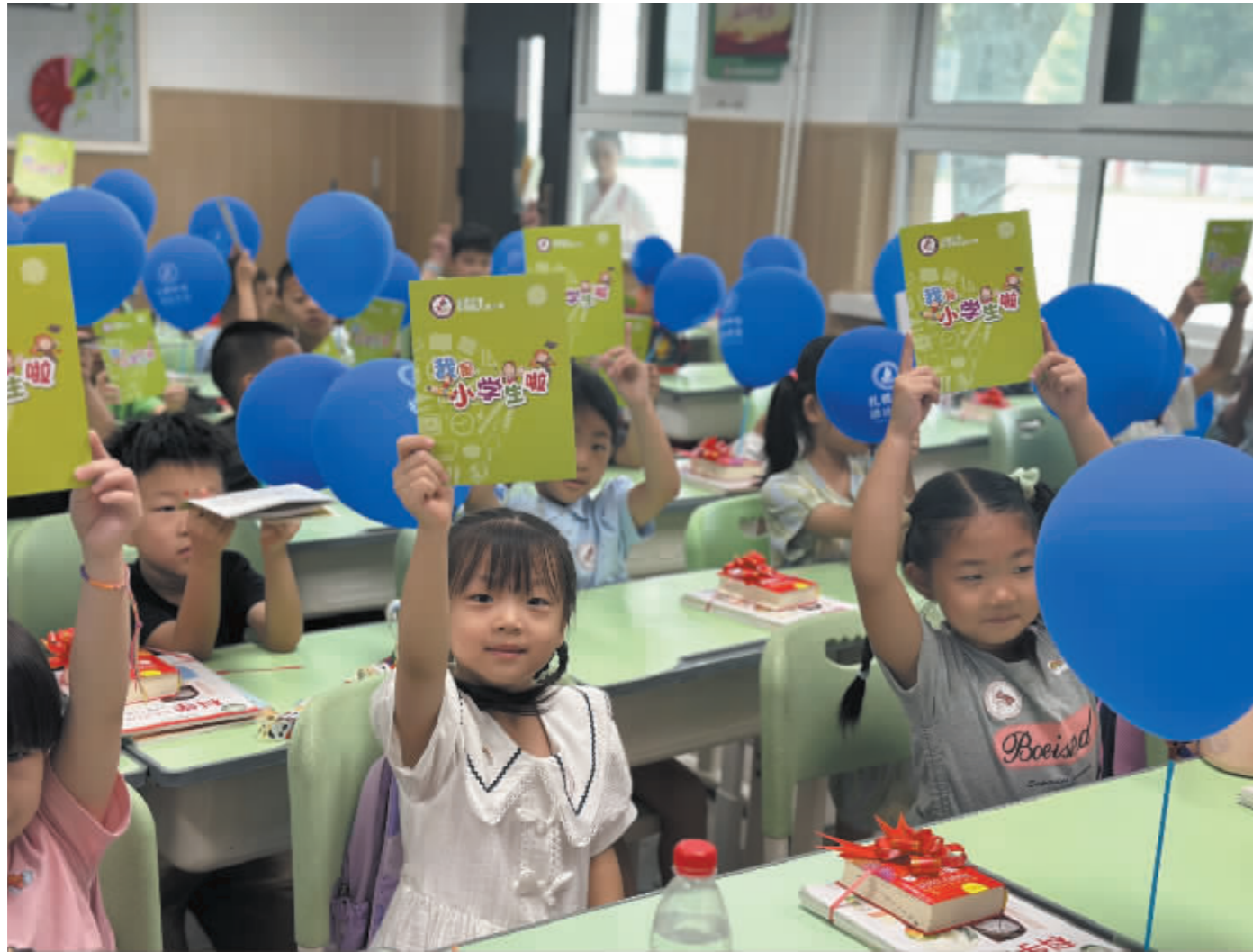
■中华南大街一年级新生展示小学生手册。(本组图片均为受访单位提供)

昨日，石家庄市中小学 2024 年秋季学期正式开学，各学校、幼儿园举行不同主题的开学典礼和开学第一课，以饱满热情、昂扬的精神状态迎接新学期和新生的到来。与此同时，石家庄接送孩子上下学的定制公交班线也开始运营。裕华区市场监管局深入开展校园食品安全守护行动，推出三项举措护航校园食品安全。藁城交警积极行动，全面启动护学岗，全力筑牢校园交通安全防线，确保学生安全顺利上下学。