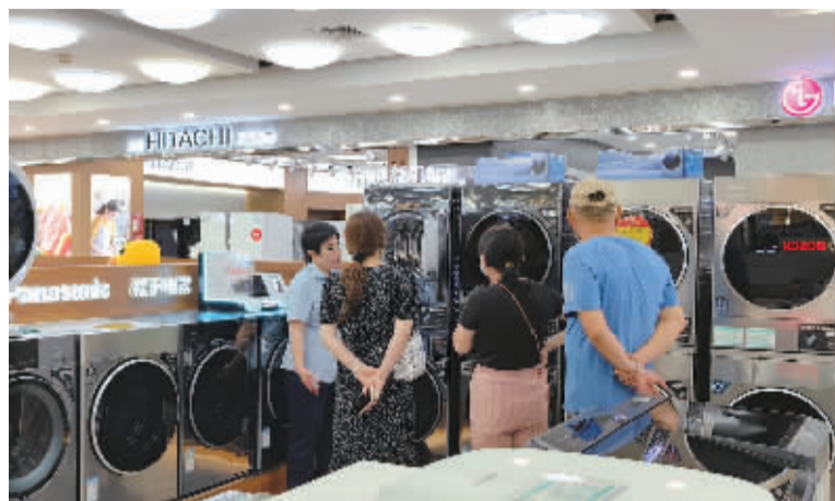
■北国电器工作人员正在向消费者介绍新品。