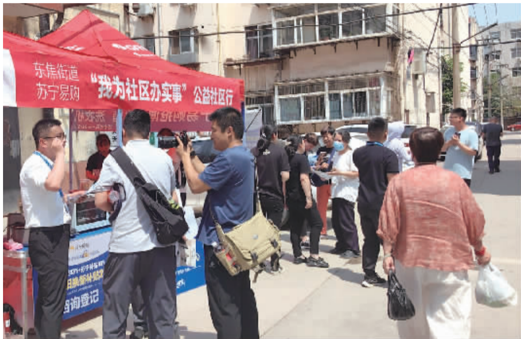
■河北苏宁易购在石市开展“以旧换新进社区”活动。

日前,商务部等4部门发布《关于进一步做好家电以旧换新工作的通知》,新一轮家电以旧换新正式启动。政策鼓励地方采用支付立减、发放个人实名代金券等方式,尽快让真金白银的优惠直达消费者,提升消费者享受补贴体验和获得感。为此,石市各家电企业、家电品牌积极响应,纷纷举办以旧换新促销活动、以旧换新进社区等多样化活动,助力石市培育绿色环保消费理念,引导消费者积极参与家电以旧换新。