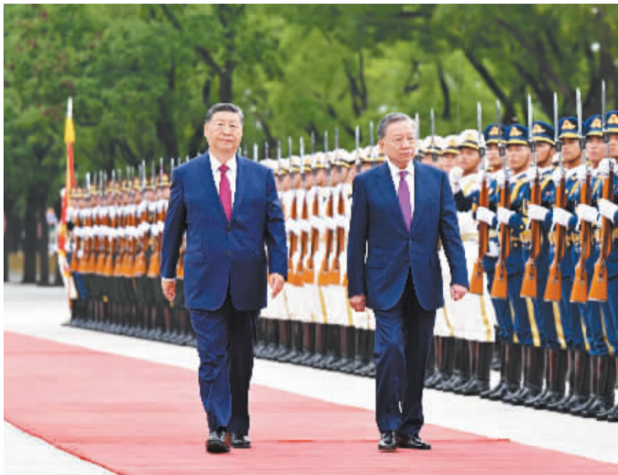
8月19日,中共中央总书记、国家主席习近平在北京人民大会堂同来华进行国事访问的越共中央总书记、国家主席苏林举行会谈。这是会谈前,习近平在人民大会堂东门外广场为苏林举行欢迎仪式。