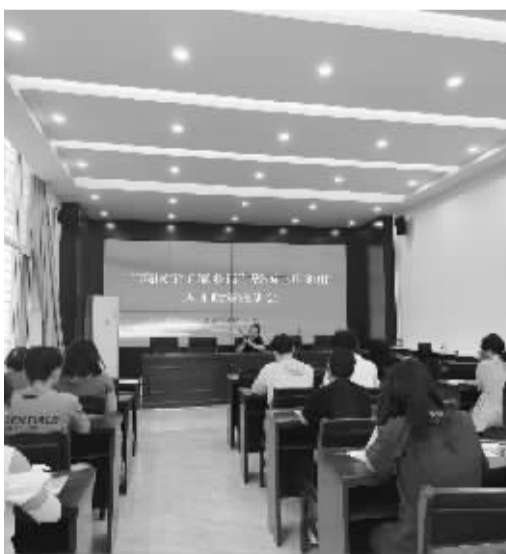
■工作人员在宣讲人才政策。

“这次宣讲会让我们有机会和青年人才进行交流,了解他们的需求。更重要的是让大学生了解了石家庄市的人才政策,让他们毕业后多了一份选择,使返乡就业创业在心中生根。”西三庄街