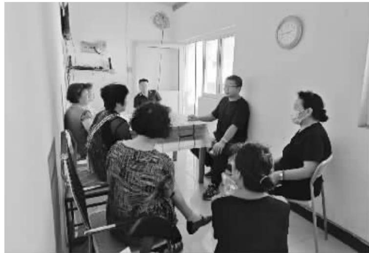
■居委会向居民征求小区管理意见。