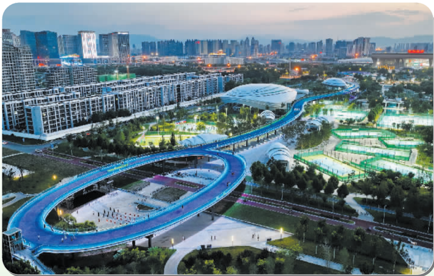
■8月5日,市民在石家庄中央绿色体育公园内运动健身(无人机照片)。