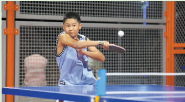
■8月7日,一名青少年在河北省石家庄市的一处体育公园内打乒乓球。