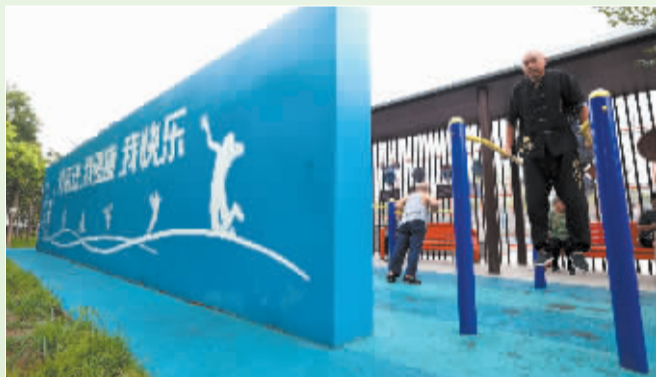
■8月7日,人们在河北省石家庄市的一处体育公园内晨练。