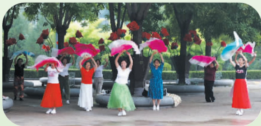
■8月7日,市民在河北省石家庄市体育公园内练习广场舞。