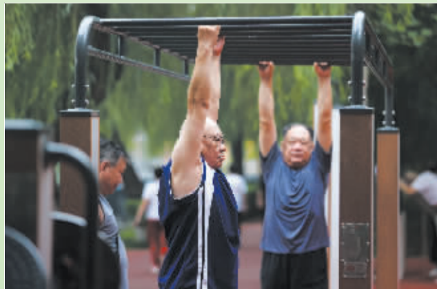
■8月7日,市民在河北省石家庄市民心河岸边的健身广场晨练。