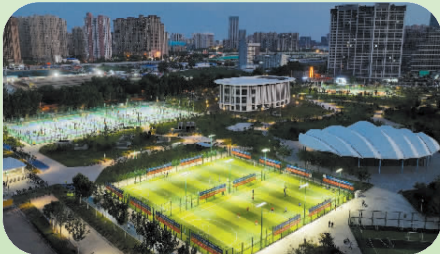
■8月5日,市民在石家庄中央绿色体育公园内踢足球(无人机照片)。