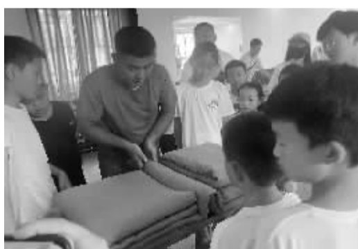
■孩子们学习叠“豆腐块”。

当天的叠被子比赛环节,无疑成为整个活动的一大亮点。随着裁判的一声令下,家长与孩子们迅速投入到比赛中。不一会儿,一条条原本松散的被子变成了棱角分明的“豆腐块”。这场叠被子比赛,不仅考验了孩子们的动手能力,更在无形中增进了