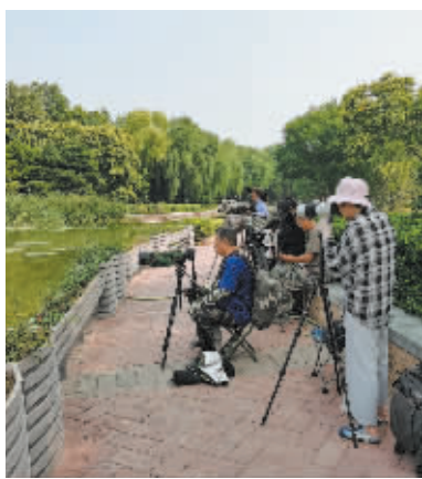
■吸引了很多鸟类摄影爱好者。

本报讯(记者 冯月静)昨日上午,在太平河畔的南高基公园内,清澈的月牙湖面上,突然传来连续不断的叫声:“苦恶、苦恶!”循着这种奇怪的声音望去,发现一只背部和胸腹部黑白分明,长得有点像鸡的鸟儿正在叫唤,它就是最近迁徙到此的“小明星”——白胸苦恶鸟。