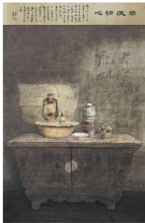
■勿泯初心(国画)李伟