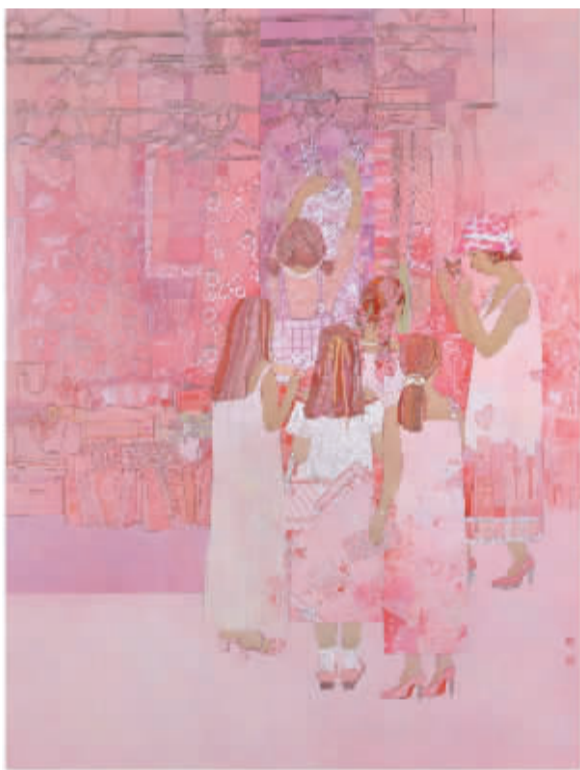
■遇见花开(国画)苏家