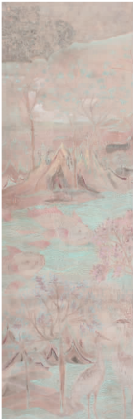
■春风习习(国画)周娜