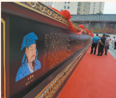
■《集王羲之书道德经》碑阳。

指导下,几易其稿,经多次研讨,完成了国内首部行草书《集王羲之书道德经》,并由河北美术出版社出版发行。该书的出版,在国内外引起了强烈反响,受到广泛好评。此后,又斥资在中国石刻之乡曲阳县完成了高2米、长30多米的《集王羲之书道德经》大型石刻。