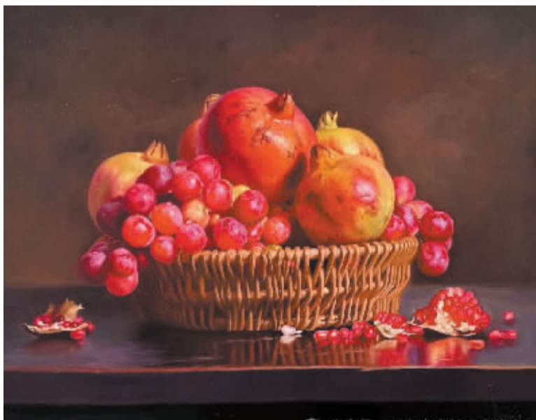
■硕果累累(油画)冯云玲