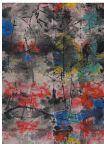
■安泊金“意”系列作品