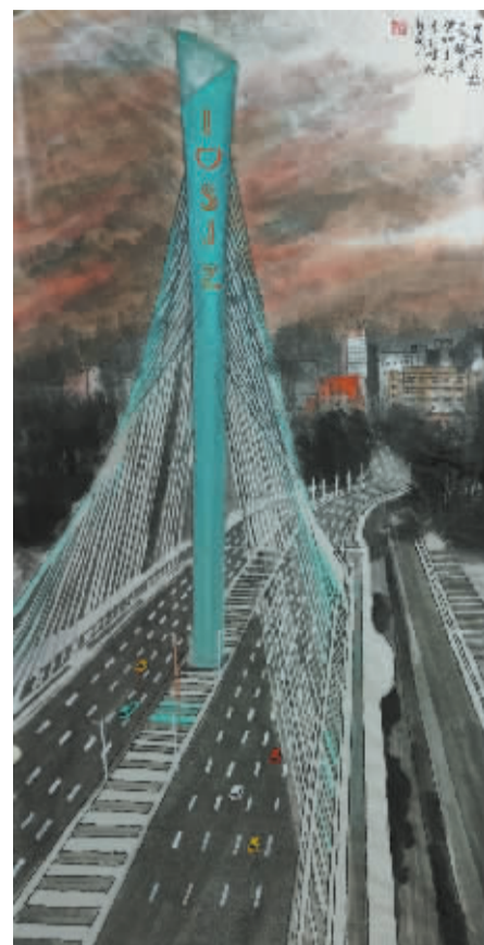
■晨曦美(国画) 焦玉峰