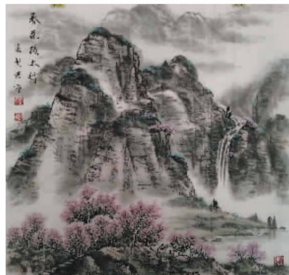
■太行春艳(国画) 孟繁君