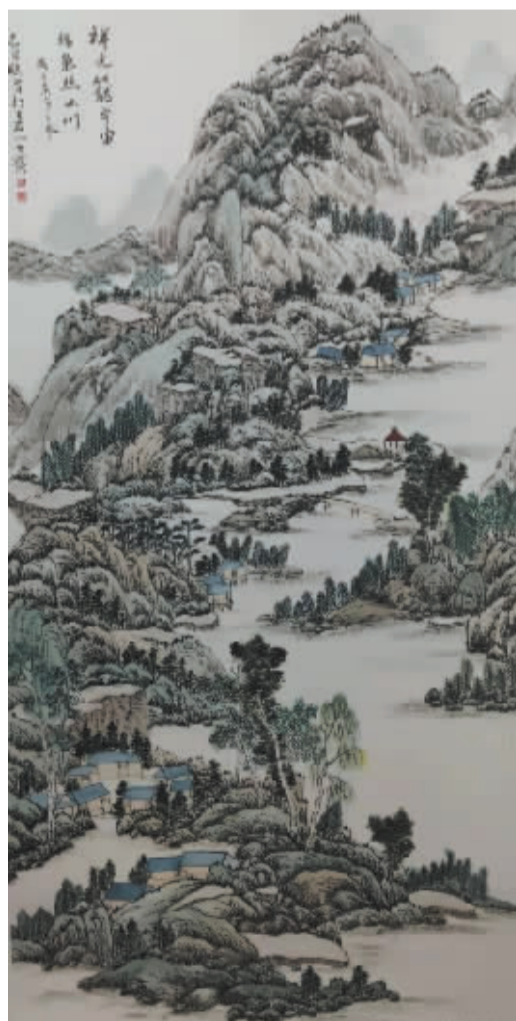
■瑞气照山川(国画) 袁卫娜