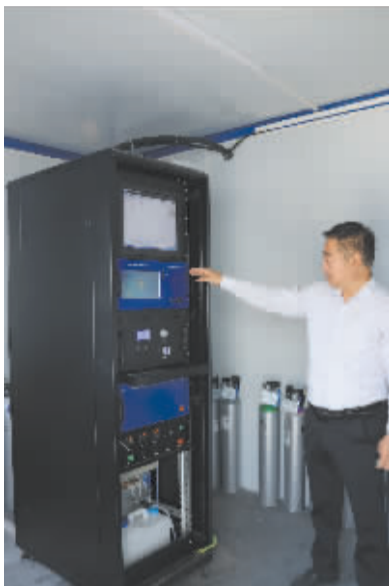
■查看环境监测数据。