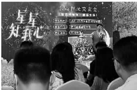
■晚报红娘为大家进行“星星知我心”主题讲座。

“青年婚恋观念改变、工作压力大、生活节奏快、社交圈子窄等是现在引发单身青年婚恋问题的重要原因。”共青团石家庄市委负责组织此次活动的负责人介绍，针对青年在婚恋交友方面的“急难愁盼”，团市委正充分发挥共青团的组织优势，带动各级团组织举办多场交友活动，努力为青年提供展现自我、交流情感、结交挚友的平台。