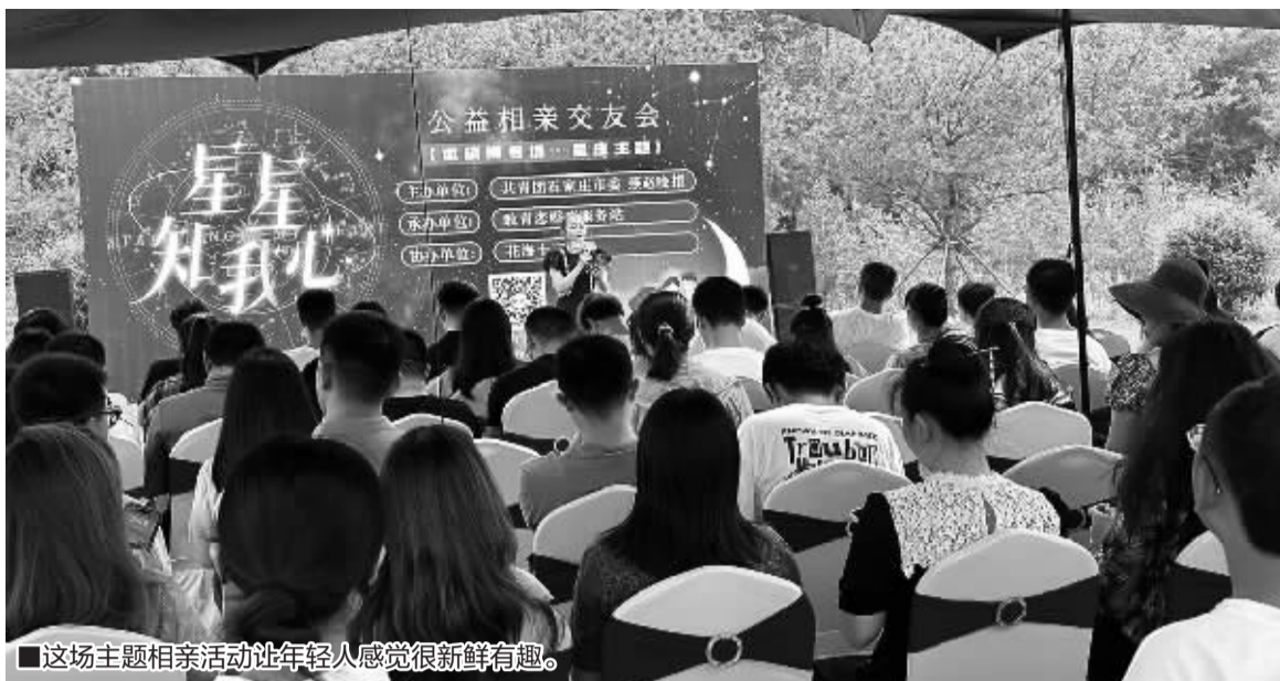
■这场主题相亲活动让年轻人感觉很新鲜有趣。