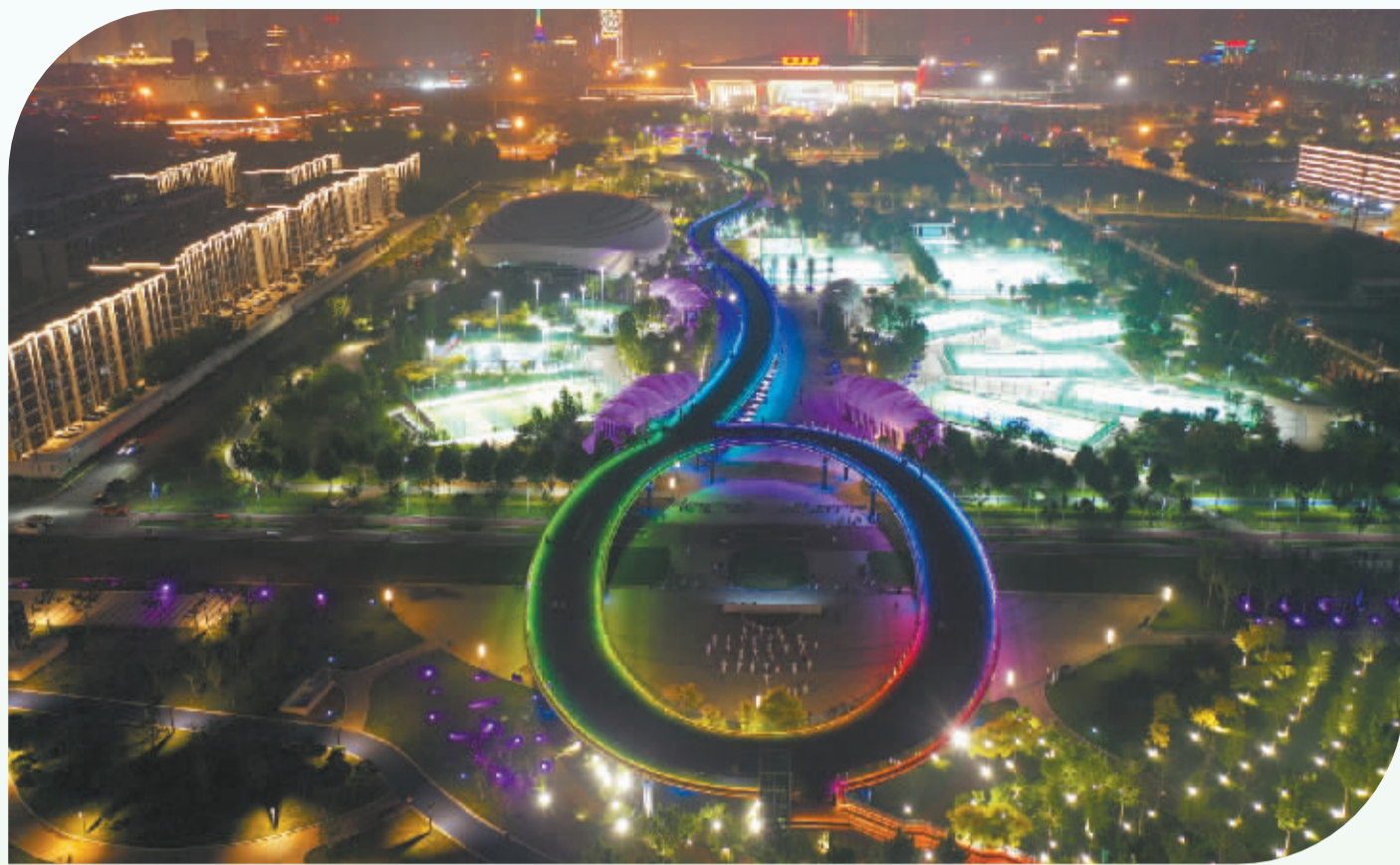
■如今的中央绿色体育公园夜晚更靓丽了。