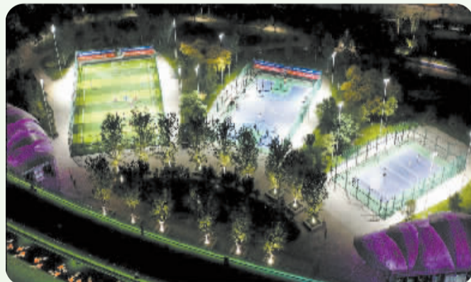
■年轻人在灯光下的球场尽情挥洒着汗水。

融合了休闲、运动与生态等诸多功能为一体的中央绿色体育公园，正凭借其绚烂的夜景，打造高铁片区夜景名片。