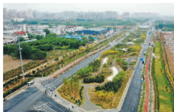
■白佛隧道上方公园。