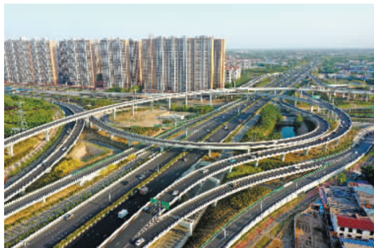
■复兴大街南三环立交桥。