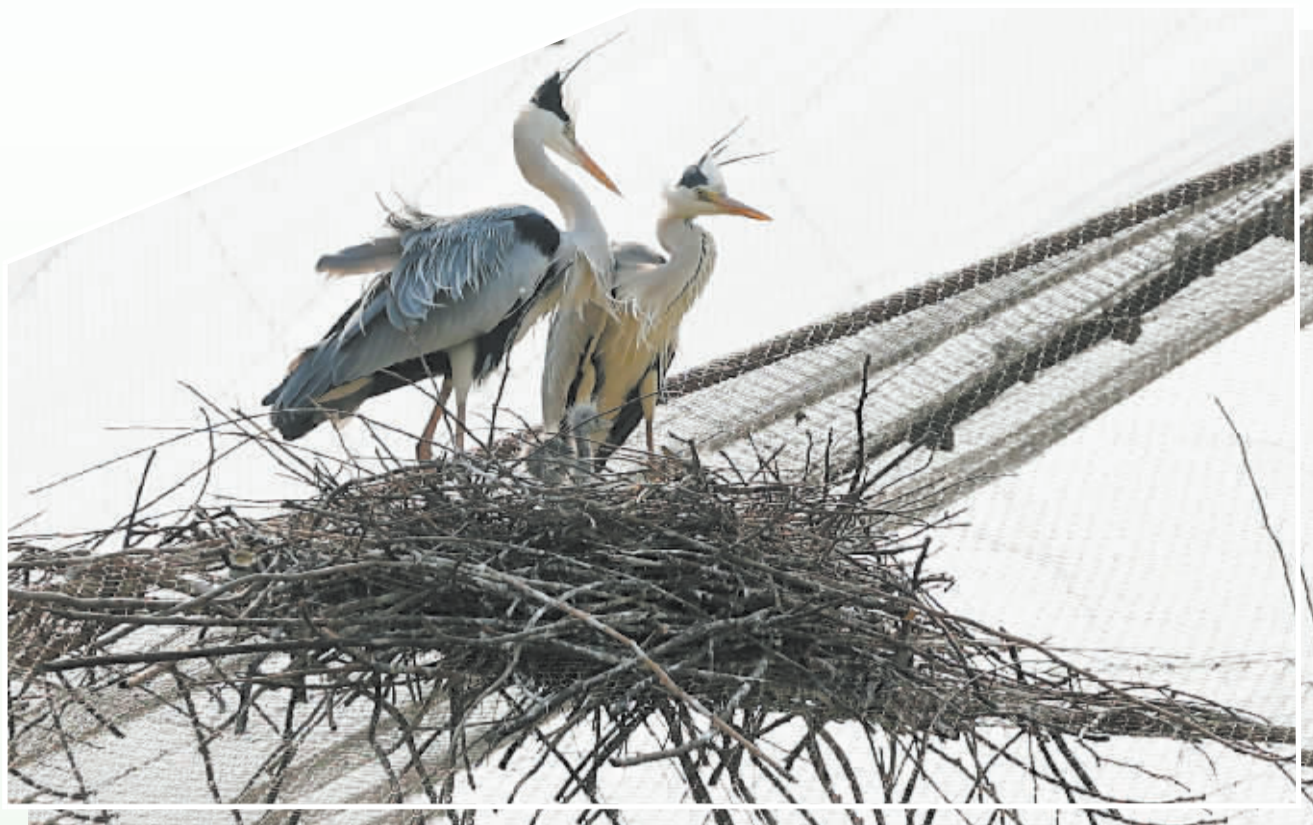
■苍鹭爸爸妈妈脚下的苍鹭宝宝好奇地望着外面的世界。

最近,两个野生苍鹭家庭在石家庄市动物园鸟语林安家,与这里的苍鹭、白鹭、黑鹤等和睦相处,形成一幅生动的大自然画卷。