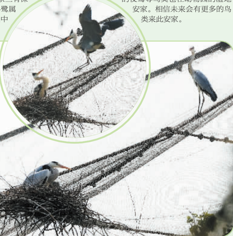
■在鸟语林顶部落户的野生苍鹭。