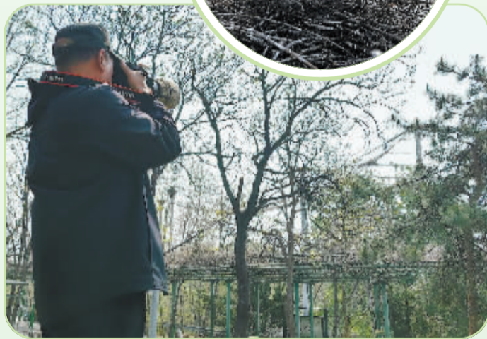
■爱鸟人士前来拍摄苍鹭。