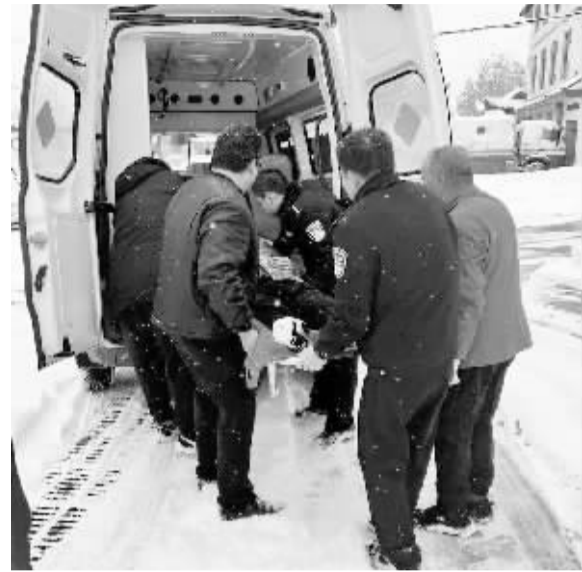
■民警和医护人员把受伤老人抬上救护车。

本报讯(首席记者 刘琛敏)近日,石家庄公安民警在执勤中及时救助了两位受伤的居民,温暖了他们的心。