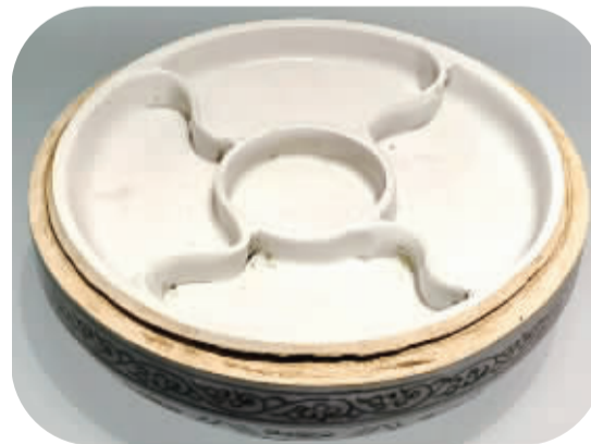
■元青花龙纹食盒什锦隔盘。