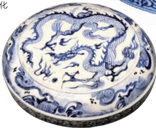
■元青花龙纹食盒盒盖。