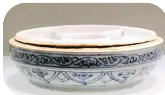
■元青花龙纹食盒底座。