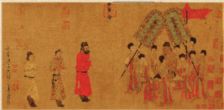
■唐 阎立本 绢本设色 38.5 厘米×129.6 厘米 现藏北京故宫博物院