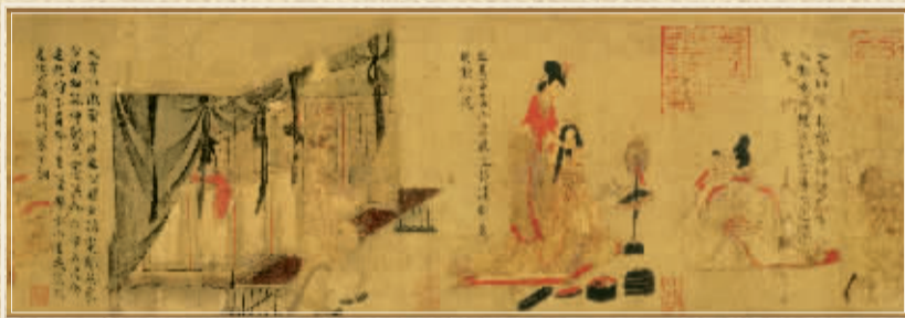
■东晋 顾恺之 绢本设色 24.8厘米×348.2厘米 现藏大英博物馆