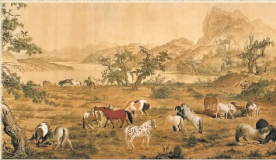
■清 郎世宁 绢本设色 102厘米×813厘米 现藏台北故宫博物院