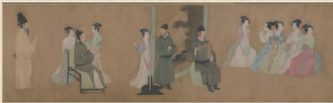
■五代 顾闳中 28.7 厘米×335.5 厘米 现藏北京故宫博物院