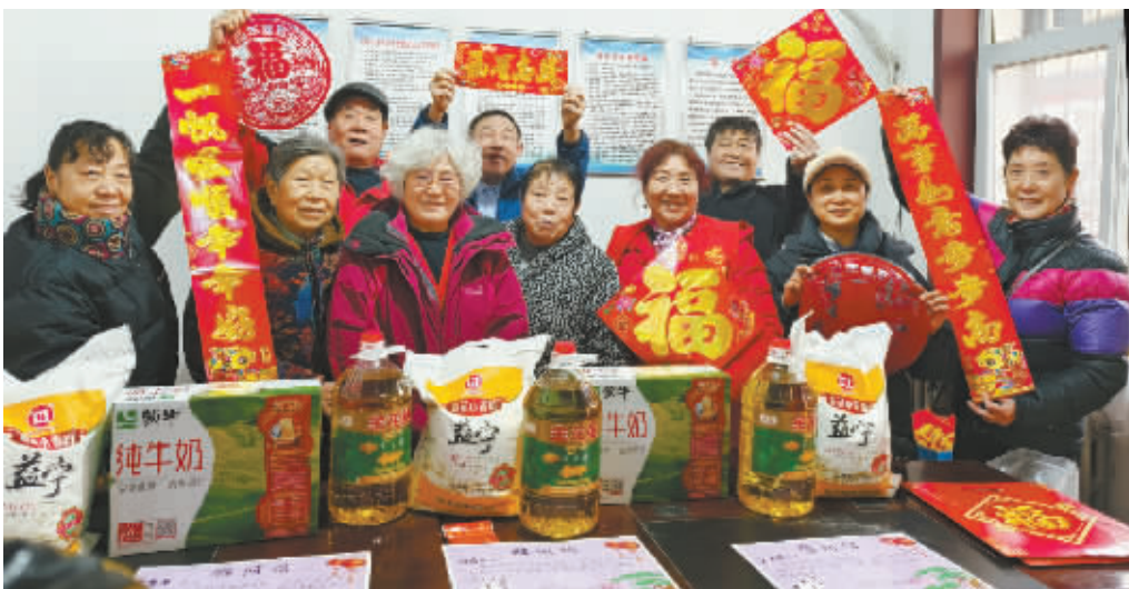
腊八节当天,宁安小区业主委员会办公室里热闹非凡。