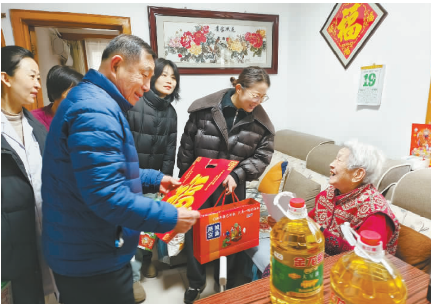
业委会的工作人员入户给老人送年货。