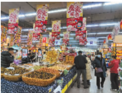
■石家庄打造一刻钟便民商圈,让市民越来越舒适便捷。

盖梅坦言,石家庄湾里庙的变化让人惊艳。“我在这里工作了5年,见证了这条商街的大变样。每天看着熙熙攘攘的客流,真的能感受到这条街的生机勃勃。”