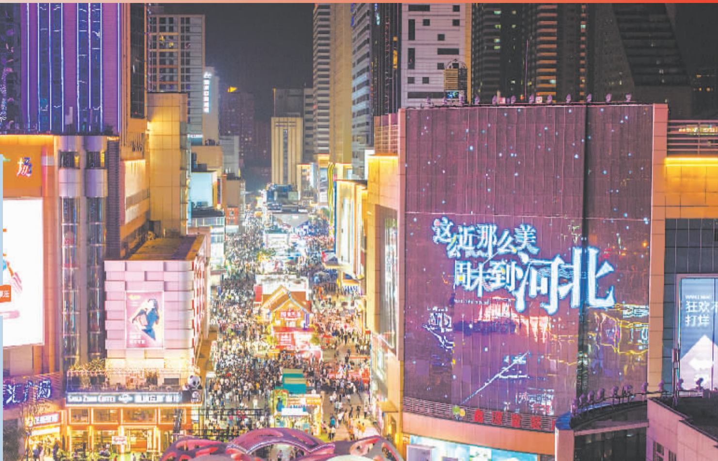
■石家庄湾里庙步行街成“全国示范步行街”。