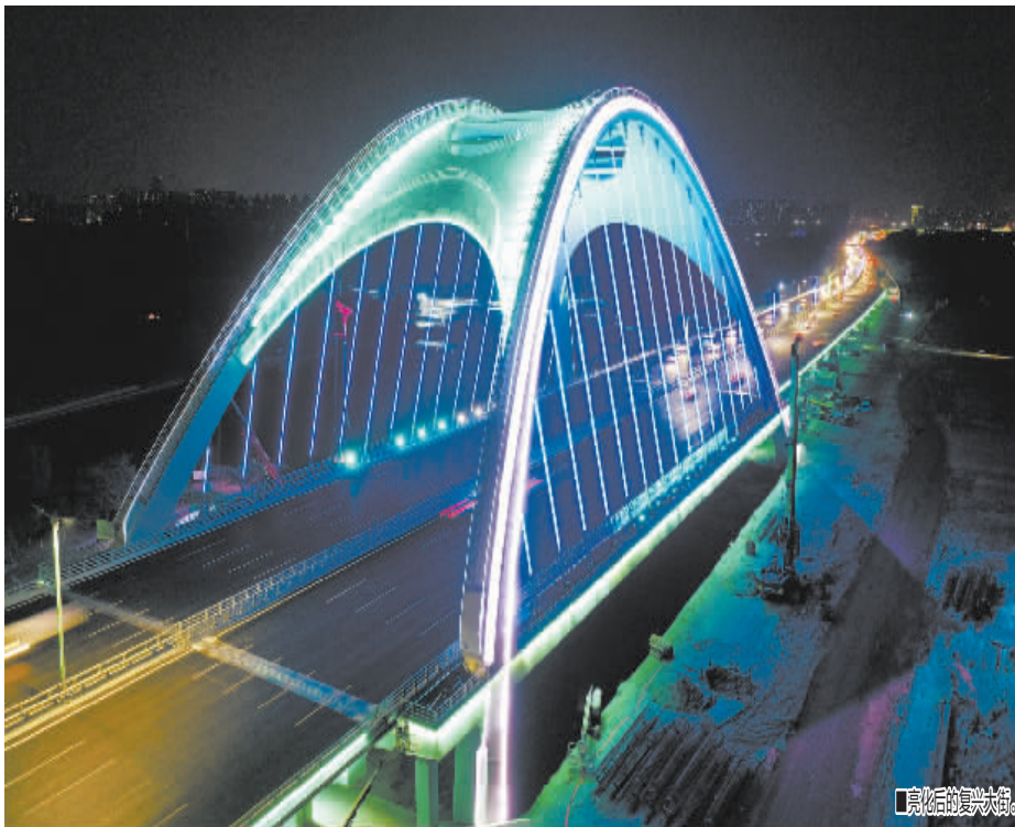
■亮灯后的复兴大街。

两条路叠加,则共同构建起石市“十”字形经济隆起带,不仅消除了城市“割裂”现象,构筑起外通内畅、转换高效、区域融合的城市路网新格局,更有效地带动周边区域产业转型升级,助推沿线装备制造、现代服务、高端商务等产业做大做强,成为激活高质量发展的新引擎,更助力石家庄打造成为本地人自豪、外地人向往的魅力之城!