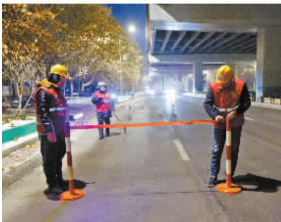
■准备开始清除冰锥。