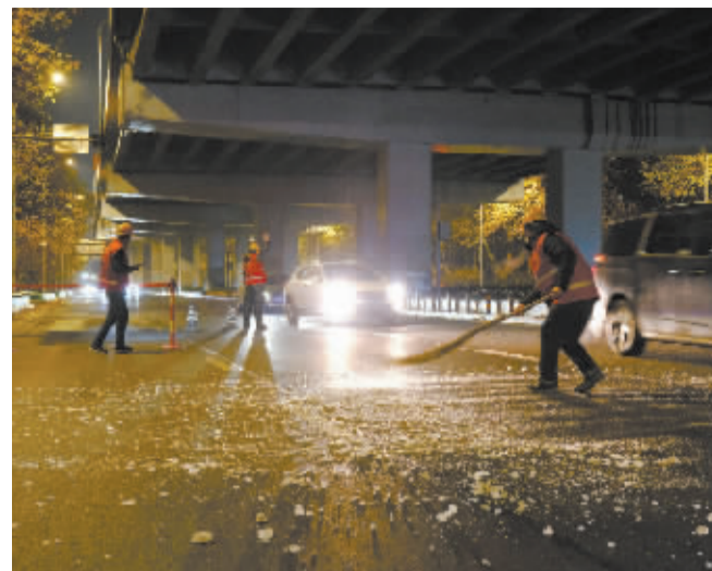
■迅速清扫敲掉的冰锥碎块。