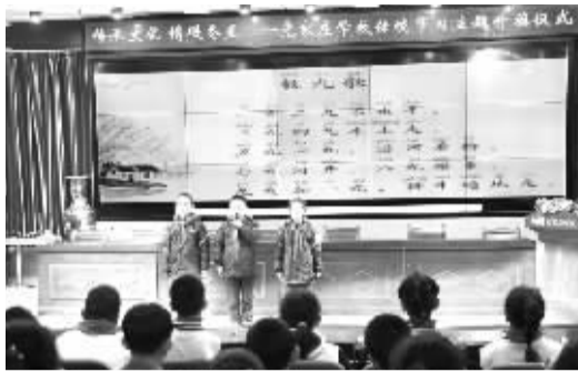
■同学们在诵读《数九歌》。

自开展文明校园创建活动以来,党家庄学校还积极开展安全交通、文明用语、文明观演(赛)、垃圾分类、志愿服务和校内“文明学生、文明教师、文明班