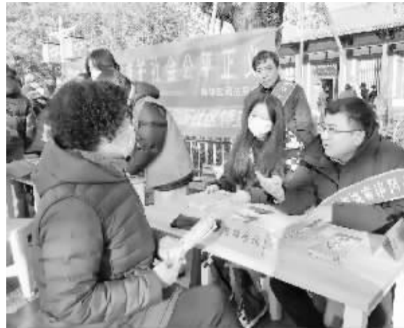
普法宣传受到居民欢迎。

本报讯(首席记者 杜慧)今年12月4日是第十个国家宪法日,为进一步弘扬宪法精神,凝聚法治力量,增强全民法治观念,12月3日,石家庄市新华区赵佗路街道联合新华区司法局、赵佗公园在赵佗路街道新时代文明实践所开展以“大力弘扬宪法精神,建设社会主义法治文化”为主题的国家宪法日集中宣传活动。